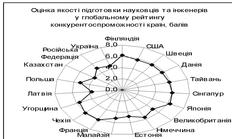
Рисунок 2 - Оцінка якості підготовки науковців та інженерів у глобальному рейтингу конкурентоспроможності країн, балів.

Якщо на початку 50-х років Україна могла пишатися якістю підготовки наукових та професійних кадрів і посідала провідні місця у світі, то сьогодні, виходячи з аналізу даних глобального рейтингу конкурентоспроможності країн (рис. 2), вона відстає від багатьох країн не лише за якістю освіти, а й за якістю підготовки науковців та інженерів, яка не відповідає зростаючим вимогам конкурентного середовища.