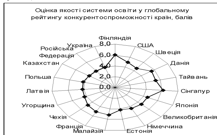
Рисунок 1- Оцінка якості освіти у глобальному рейтингу конкурентоспроможності країн, балів.

– суттєве відставання української освіти від європейських та світових стандартів якості освіти (див. рис. 1);