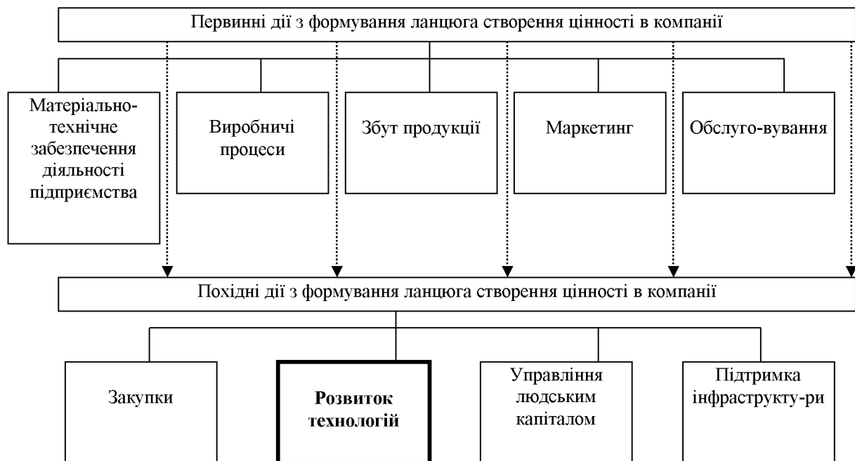
Рисунок 2 – Місце розвитку технологій в процесі формування ланцюга створення цінності за М. Портером

виникла необхідність у зміні характеру та принципів управління, у виділенні його у якості окремої управлінської діяльності, в удосконаленні окремих власне управлінських операцій. З цим періодом пов'язують переважна більшість провідних зарубіжних і вітчизняних вчених становлення наукових основ управління і початок розвитку різних шкіл менеджменту. Саме у ХХ столітті з'являються ключові категорії та поняття управління, управлінської діяльності в тому числі й поняття технологій управління. ТОВАЖНЯНСЬКИЙ Л.Л., РОМАНОВСЬКИЙ О.Г., ПОНОМАРЬОВ О.С., ГНАТЮК О.А. [4, с. 14] зупинились у розкритті етапів технологізації, але не розкрили власне етапи виникнення та розвитку управлінських технологій. У зв'язку із цим представимо авторське бачення цього процесу, яке сформувалось на основі узагальнення досліджень різних вчених щодо етапів та особливостей розвитку менеджменту та теорії управління.