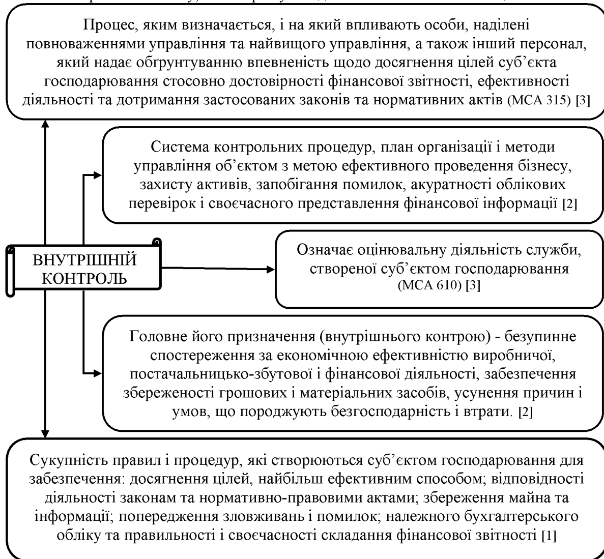
Рисунок 1 – Визначення поняття внутрішнього контролю

Згідно Міжнародного стандарту аудиту (МСА) 315 “Розуміння суб’єкта господарювання і його середовища та оцінка ризиків суттєвих викривлень” внутрішній контроль є процесом, який формує і залучає осіб, наділених керуючими повноваженнями, керівництво і інший персонал, щоб забезпечити обґрунтовану впевненість з точки зору забезпечення надійності бухгалтерської (фінансової) звітності і результативності операцій і відповідності їх вживаним законам і нормам. Іншими словами, це означає, що внутрішній контроль визначається і реалізується для усунення визначених ризиків бізнесу, які погрожують досягненню поставлених цілей.