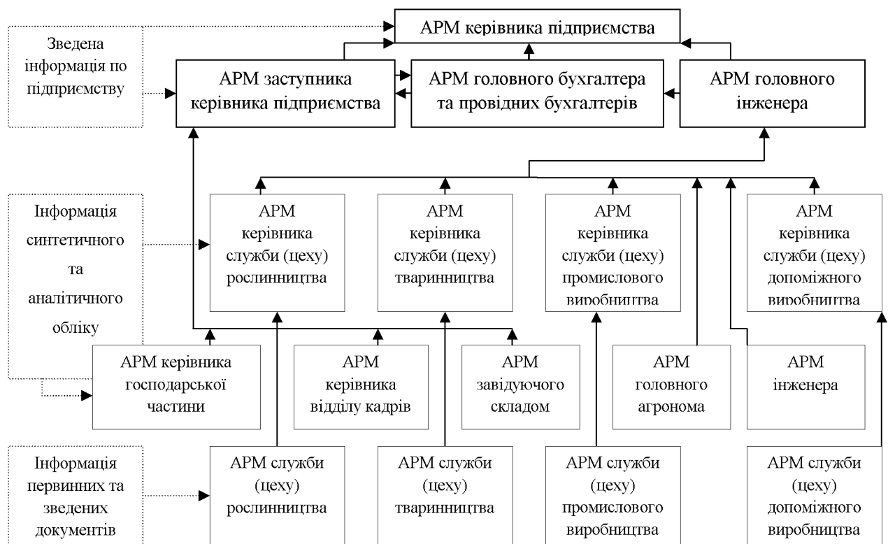
Рисунок 1 - Схема організації обліку й контролю фінансових результатів із застосуванням локальної комп'ютерної мережі

Кількість автоматизованих робочих місць (АРМ) залежить від організаційної структури сільськогосподарських формувань та їх фінансових можливостей, масштабів автоматизації обліково-контрольних процесів. Тому саме найбільш типова організаційна структура центрів відповідальності в сільськогосподарських формуваннях, на нашу думку, може бути покладена в основу АРМ керівників виробничих і збутових підрозділів сільськогосподарських підприємств (рис. 1).