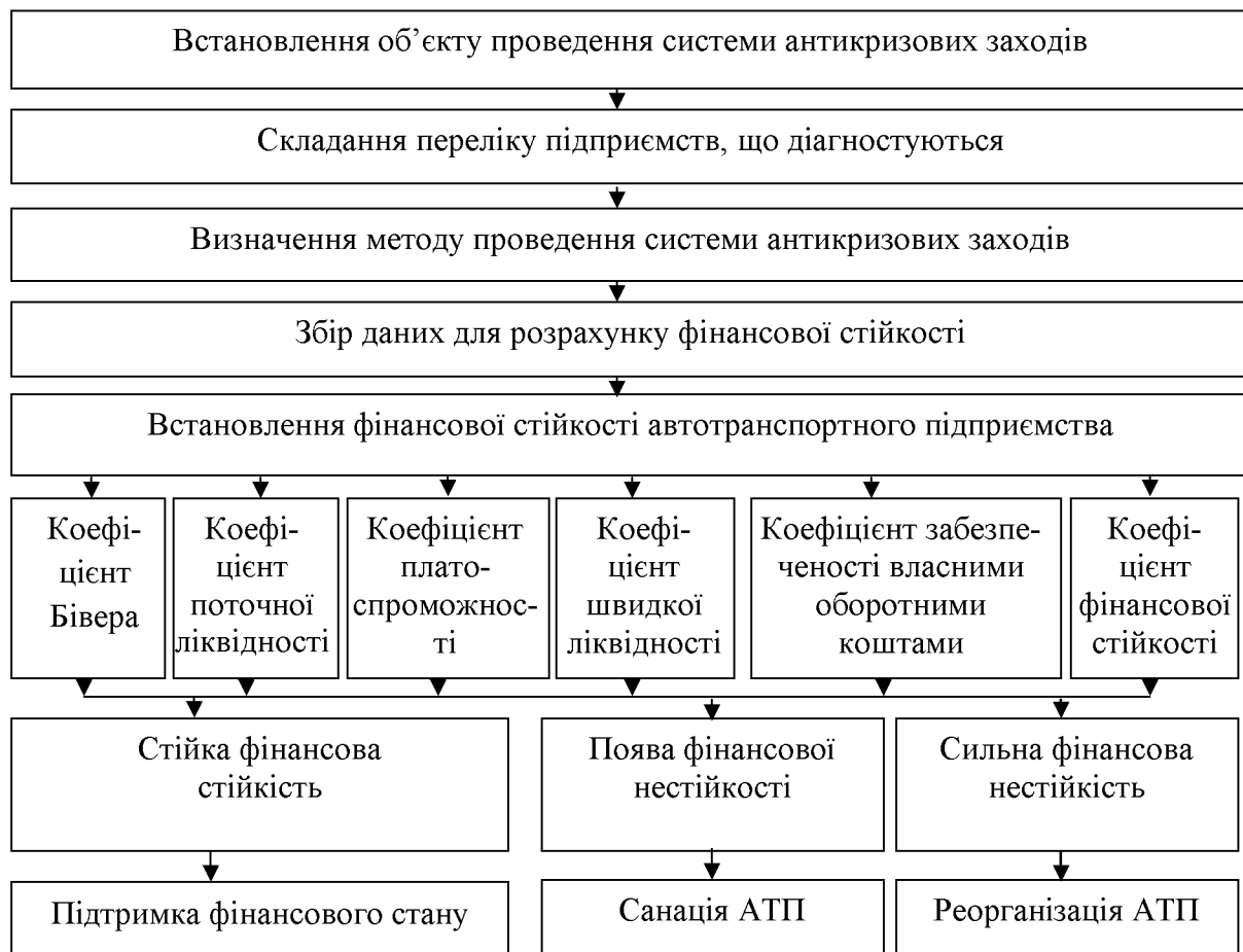
Рисунок 1 – Алгоритм застосування антикризових заходів на автотранспортному підприємстві

Якщо на автотранспортному підприємстві відбувається стійка фінансова стійкість то підприємству не загрожує банкрутство і воно не потребує подальших заходів.