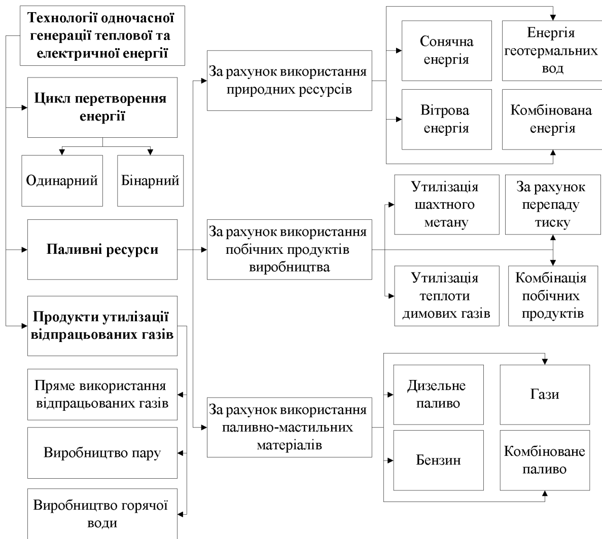
Рисунок 1- Класифікація технологій одночасної генерації теплової та електричної енергії

Базуючись на роботах [1-29] слід виділити основні частини будь – якої машини для когенерації теплової та електричної енергії, які детально представлені на рис. 2.