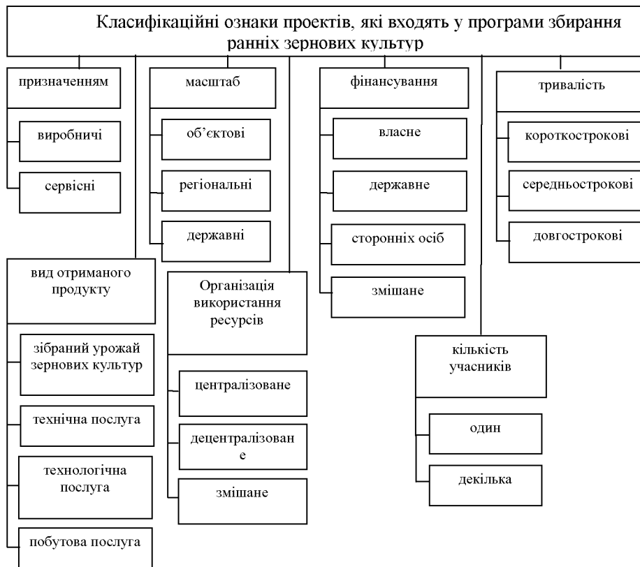
Рисунок 2 – Класифікація проектів, які входять до програм збирання раних зернових культур

Проекти, які входять до програми збирання зернових культур, мають зв'язки, які можна класифікувати за дванадцятьма класифікаційними ознаками (рис. 3).