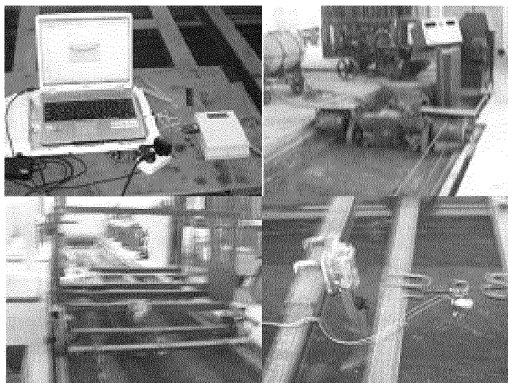
Рисунок 1 – Рабочая тележка с образцом сошника и измерительным оборудованием

Фиксирование сигналов, поступающих от датчика, реализуется с помощью специальной программы SuperTermV2.21 с частотой дискретизации 100 ms. Математическая обработка результатов измерений [9] и их графическое представление осуществляется с использованием программного обеспечения Microsoft Excel и MathCAD (рис. 2).