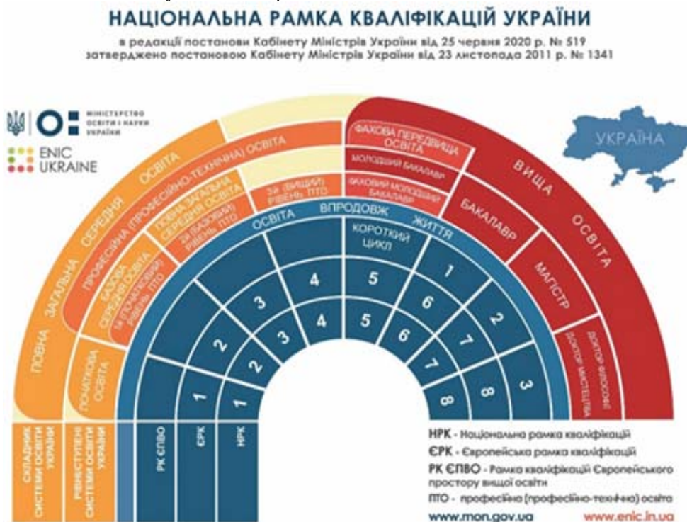
NATIONAL QUALIFICATIONS FRAMEWORK OF UKRAINE Approved by the Resolution of the Cabinet of Ministers of Ukraine № 1341, dated November 23, 2011, as amended by the Resolution of the Cabinet of Ministers of Ukraine № 519, dated June 25, 2020

The last admission for the educational-qualification level of Specialist was held in 2016. After the Law of Ukraine «On Higher Education» entered into force on 06 September 2014, the educational-qualification level of Specialist is equated to a Master's degree of higher education.